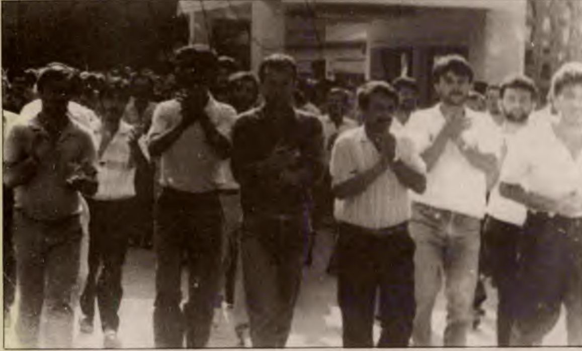
Dok Gemi-İş başkanı merasimde yaptığı konuşmada işvereni övdü

TKP'mizi güçlendirelim! Devrimci sınıf savaşımını yükseltelim!